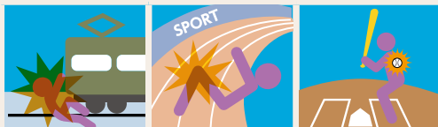
JR職域内(関連会社含む)で発生した運行中の列車・自動車等における死傷事故 加盟組合主催・JR会社・関連会社等との共催によるスポーツレクリエーション中のケガ JR会社・関連会社等主催のスポーツレクリエーション中のケガ(野球・ソフトボール・フットサル・バレーボール・スキーのみ)