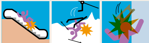
エスカレーター乗車中のケガ リフト乗車中・降車時のケガ 構造物からの物の落下等による被害